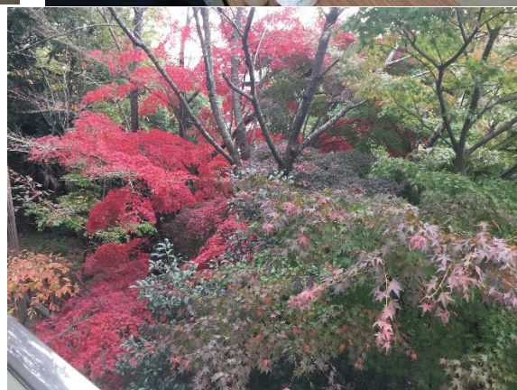
ベランダから庭の紅葉もきれいです😊