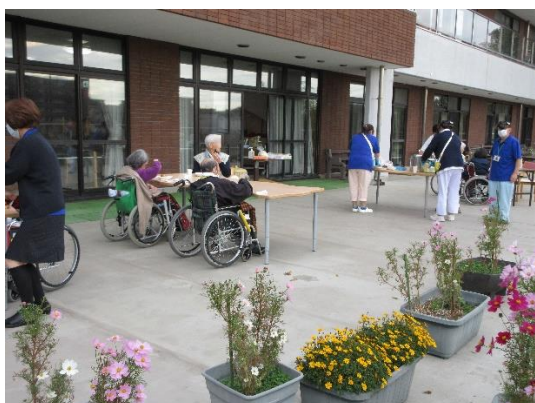
プランターには秋の花…